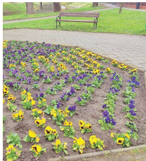
Kolorowe bratki przy ulicy Mostowej

kwiaty, dlatego dokładamy wszelkich starań, aby było ich coraz więcej na terenie Kościana – informuje burmistrz Piotr Ruszkiewicz. Kwitnące róże będziemy mogli zobaczyć wkrótce m.in na: Placu Paderewskiego, Szarych Szeregów oraz przy ulicy Surzyńskiego. Przypominamy, że w ubiegłym roku róże zostały posadzone przy ulicy Młyńskiej, Gostyńskiej oraz na części Placu Paderewskiego.